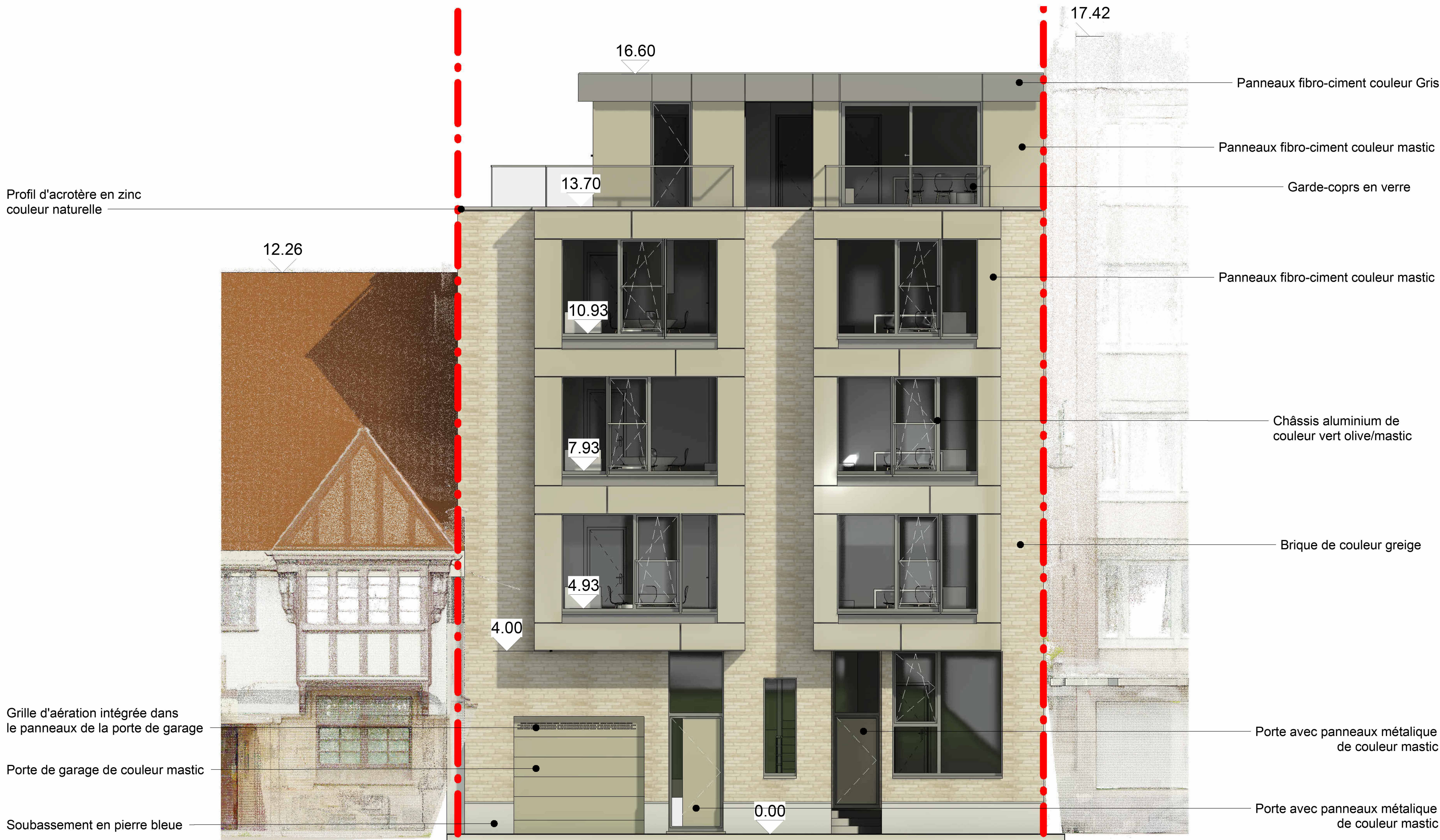
Elévation arrière 1 : 100